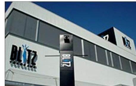
横浜BLITZ 横浜市西区みなとみらい5-1-3 募集: 500人