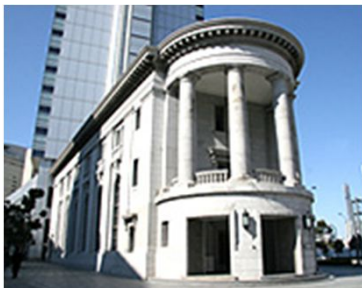
ヨコハマ創造都市センター(YCC) 3階 横浜市中区本町6-50-1 募集: 200人